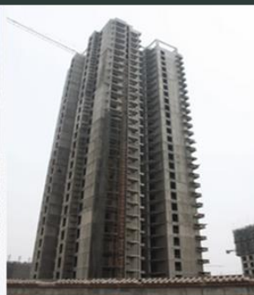
单位工程施工组织设计(例:针对一栋楼)