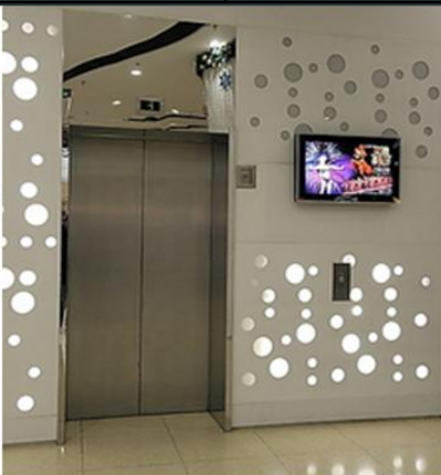
施工方案 (例:1部电梯)