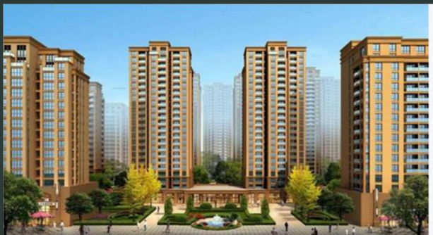
施工组织总设计(例:针对整个小区)